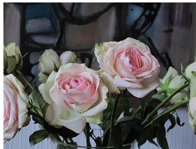
- 1,0 EV