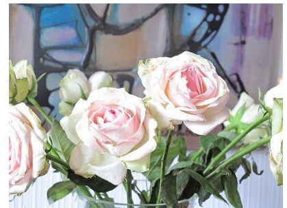
+ 1,0 EV

Erstellt man die Belichtungsreihe aus der Hand, werden sich Verschiebungen nicht vermeiden lassen. Das wird gut sichtbar, wenn man die Bilder überlagert.