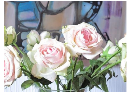
+ 1,0 EV

Erstellt man die Belichtungsreihe aus der Hand, werden sich Verschiebungen nicht vermeiden lassen. Das wird gut sichtbar, wenn man die Bilder überlagert.