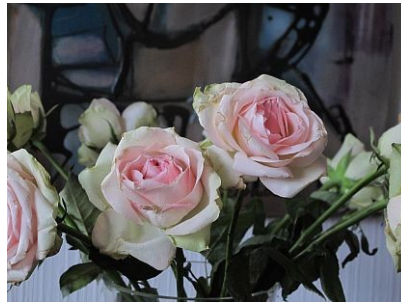
- 1,0 EV